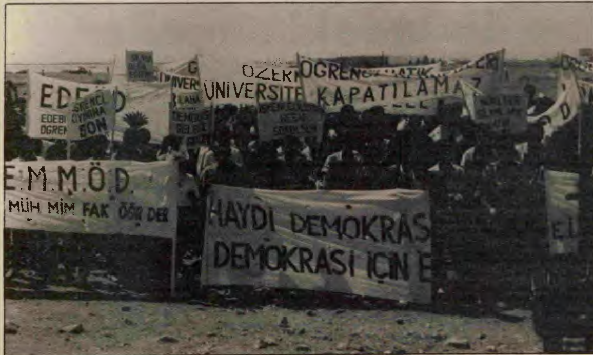
Öğrenci hareketi oportünizmin ruhsuzluğuna “sol”ların köksüzlüğüne teslim olmadan, militan eylemlerle işçi sınıfının savaşı yolundan ilerleyerek, miting meydanlarını onbinlerle dolduracaktır.